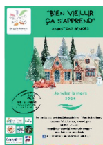
Bien Vieillir Animations pour les personnes de 60 ans et +