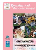
Rencontres éveil Pour les 0-3 ans avec leurs parents ou leur assistant maternel

• Foyer des jeunes/ Animations Jeunesse. Pour tous les jeunes à partir de la 6 e Le foyer des jeunes de Martigné Briand (9 Rue Gaubretière, derrière la mairie) est ouvert tous les vendredis, de 18h à 20h ou de 18 à 21h45, une semaine/2. Sur simple demande préalable, Dorian Clémot, animateur jeunesse référent de la commune de Martigné, peut récupérer vos jeunes à la sortie du collège et ouvrir le foyer dès 16h30 ! Au programme des soirées : repas, jeux, films, baby foot.... Selon les envies de jeunes. Gratuit- Ouvert à tous, à partir de la 6- Dorian Clémot : 06 75 90 04 69