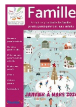
Famille Animations à partager en famille (ados/enfants) Moments entre parents