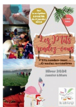
Les P'tits RDV Animations tout public en semaine et le week-end

• Nouveaux programmes d'animations à découvrir : Les programmes pour le premier trimestre 2024 sont disponibles. Nous vous invitons à les consulter sur notre site internet ou à les récupérer au local de Martigné. De nombreuses activités à (re)découvrir, avec ou sans inscription